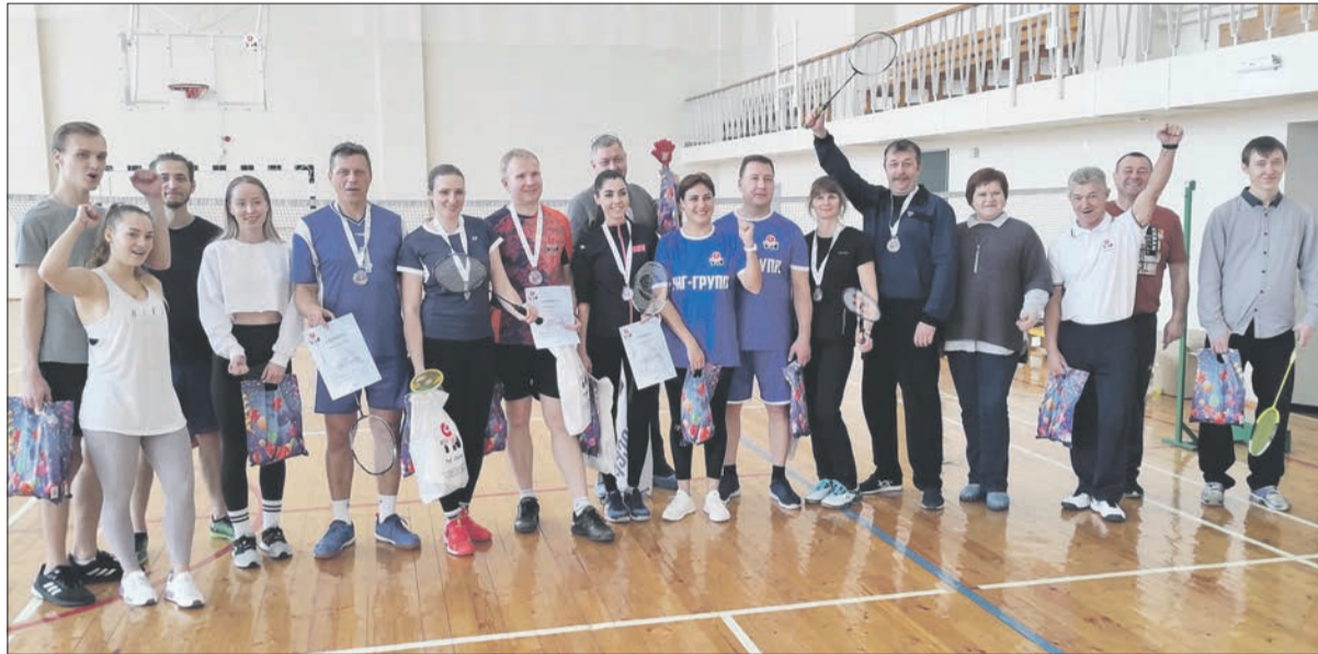
Участники турнира по бадминтону на кубок ТНГ-Групп

Шесть пар (парная категория — мужчина и женщина) из подразделений ТНГ-Групп сражались за звание победителей. Отлично, что наряду с ветеранами участие принимает молодёжь. Так, дебютантами соревнований стали молодые специалисты НТУ и ЭВНТ. Хочется надеяться, что они серьёзно заинтересовались игрой в бадминтон и не ограничатся только одним турниром, а будут регулярно